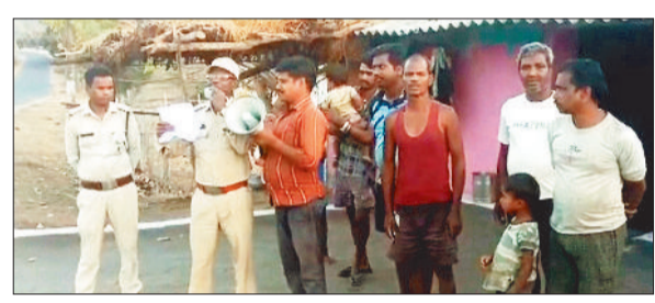
ग्रामीणों को मुनादी कर जागरूक करते वनकर्मियों।

जंगल को आग से बचाने के लिए जनकपुर वन परिक्षेत्र के वनकर्मियों द्वारा गांव-गांव जाकर ग्रामीणों को समझाईस देते हुए श्लोगन के माध्यम से मुनादी करके जागरूक किया जा रहा है, जिससे इस वर्ष जनकपुर परिक्षेत्र के जंगलों में आगजनी की छुट फुट घटनाओं को छोड़कर बड़ी घटनाएं नहीं हो पाई है, जिसकी वजह से वर्तमान समय तक जनकपुर परिक्षेत्र में आगजनी की घटनाएं पिछले वर्षों की अपेक्षा इस वर्ष सीमित रही है। प्राप्त जानकारी के अनुसार महुआ फूल सीजन शुरू होने से पूर्व