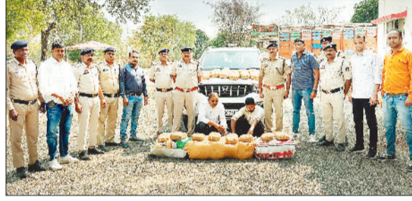
पुलिस गिरफ्त में आरोपी व गांजा समेत जब्त वाहन।

स्कार्पियो वाहन में पुलिस की बत्ती लगाकर गांजे की तस्करी करने वाले दो आरोपियों को कोरिया पुलिस ने गिरफ्तार किया है। आरोपी दूसरे राज्य से गांजे की तस्करी लंबे समय से कर रहे थे। मुखबिर से सूचना मिलने पर कोरिया पुलिस ने एक बड़ी कार्रवाई करते हुए 74 किलो 450 ग्राम अवैध मादक पदार्थ गांजा जब्त किया है, जिसकी कीमत करीब 11 लाख रूपए आंकी गई है। पुलिस ने इस मामले में दो कुख्यात तस्करों को गिरफ्तार किया है, जो ओडिशा के