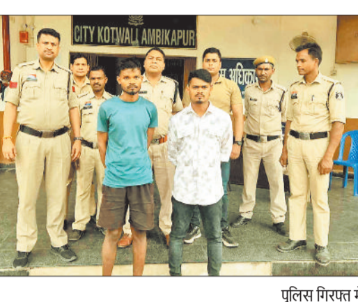
पुलिस गिरफ्त में आरोपी व जब्त कार।

■ ओड़िसा से गांजा लाकर कर रहे श्राद्धक की तलाश