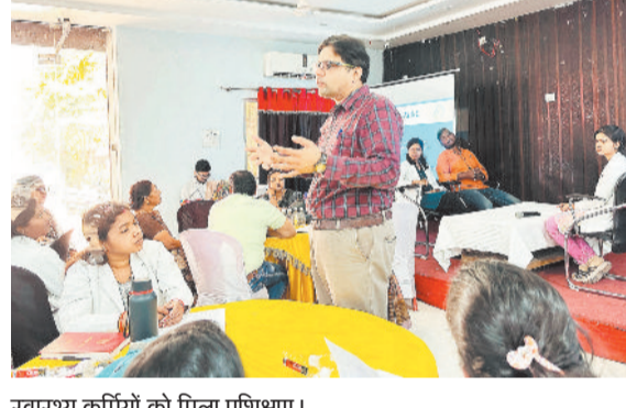
स्वास्थ्य कर्मियों को मिला प्रशिक्षण।

बैकुण्ठपुर। जिले में पहली बार कंगारू मदर केयर (केएमसी) तकनीक पर स्वास्थ्य कर्मियों को प्रशिक्षण दिया गया। यह प्रशिक्षण कार्यक्रम जिला स्वास्थ्य विभाग, यूनिसेफ और छग सरकार के सहयोग से आयोजित किया गया। कंगारू मदर केयर तकनीक नवजात शिशुओं के लिए एक महत्वपूर्ण जीवन रक्षक तकनीक है, जिसमें शिशु को मां की छाती से त्वचा से त्वचा संपर्क में रखा जाता है। यह तकनीक विशेष रूप से समय से पहले पैदा हुए या कम वजन वाले बच्चों के लिए अत्यंत फायदेमंद साबित होती है।