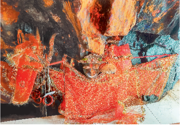
रमदइया धाम में बिराजी मां।

चैत्र नवरात्र में आदिशक्ति माता की देवी मंदिरों में भक्तिभाव के साथ प्रतिदिन विभिन्न रूपों की पूजा-अर्चना की जा रही है। देवी मंदिरों एवं आस्था केन्द्रों में माता के दर्शन के लिए श्रद्धालुओं का सुबह होने के साथ ही तांता लगा हुआ है। 5 अप्रैल को महाष्टमी तिथि है, इस दिन माता के महागौरी रूप की पूजा-अर्चना की जाती है। इस दिन माता का विशेष रूप से श्रृंगार कर श्रद्धालुओं के द्वारा पूजा-अर्चना विधि-विधान के साथ किया जाता है। पूजा एवं महाश्रांती कर श्रद्धालुओं का प्रसाद का वितरण किया जाता है, इसके अलावा देवी मंदिरों में इस दिन विशेष हवन-पूजन का आयोजन भी किया जाता है, इससे पूरा वातावरण हवन-पूजन के कारण सुवासित हो उठता है।