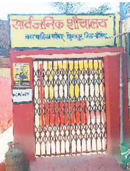
सार्वजनिक शौचालय में लगा ताला।

बैकुण्ठपुर। नगर पालिका परिषद बैकुण्ठपुर द्वारा निर्मित एक सार्वजनिक शौचालय में एक पखवाड़े से अधिक समय से पूर्णतः तालाबंदी कर दी गई है, इससे आम जनता को परेशानियों का सामना करना पड़ रहा है। शहर के पुराने बस स्टैंड के पास एक कोने पर नगर पालिका परिषद बैकुण्ठपुर द्वारा लाखों रूपए खर्च कर सार्वजनिक शौचालय का निर्माण कराया गया है, ताकि लोगों को सुविधा मिल सके, लेकिन नपा के जिम्मेदारों के उदासीनता के चलते काफी समय से सार्वजनिक शौचालय में ताला बंदी पूर्णतः कर दी गई है।